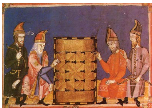
O jogo do Alquerque dos doze na Idade Média. Livro de Jogos de Afonso X, o Sábio, 1283

A transversalidade social e cronológica dos jogos, neste caso de tabuleiro, encontra-se espelhada na distribuição das suas peças por toda a sequência histórica identificada nos trabalhos arqueológicos. As 196 peças de jogos encontram-se presentes em todas as épocas, desde os inícios da nossa Era até à Idade Moderna, com maior relevo para a Idade Média onde se contabilizaram metade das ocorrências.