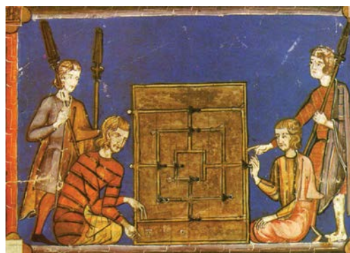
O jogo do Moinho na Idade Média. Livro de Jogos de Afonso X, o Sábio, 1283